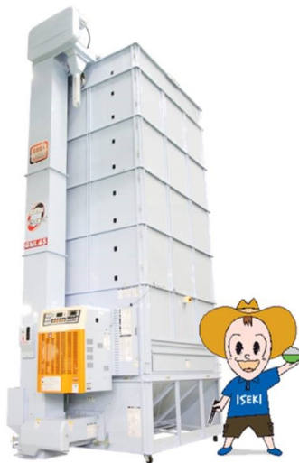
乾燥機GMLシリーズH型