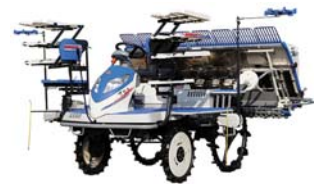
田植機さなえ NP シリーズ