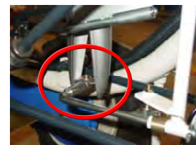
ホッパークリーナー

ホッパー（くちばし）内に付着した泥を取り除き、安定した連続植付けを可能にします。