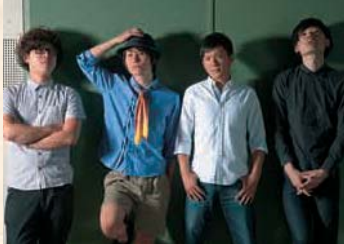
「茨城のうた」Mary days story