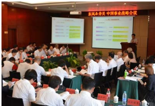
中国事業合同会議の様子

今後は、東風汽車グループと当社の総力を合わせて、農業機械の提供を通じて中国の農業発展に貢献してまいります。