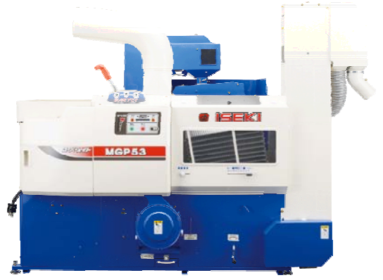
MGP 5 3