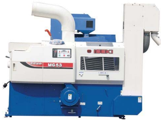
MG 5 3