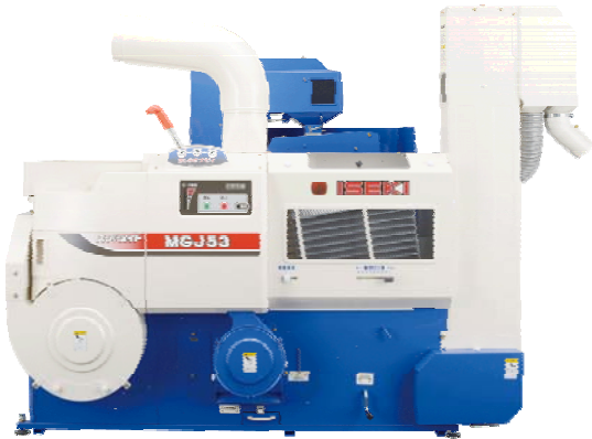
MG J 5 3