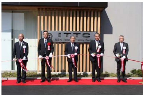
オープンに先立ちテープカットが行われました。

本日から「ものづくりリーダー養成コース」が開講し、12名の第一期生が5ヶ月に亘る研修のスタートを切りました。