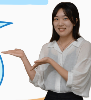
㈱ISEKI Japan 管理部 江藤

P33~34では、2025年に新設したISEKI Japanの概要と設立の背景についてご紹介しています！