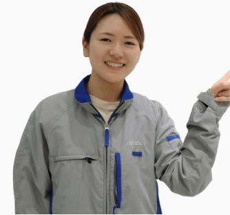
㈱ISEKI Japan 営業推進部 海發

P67~70では女性社外取締役と社員による座談会の様子をご紹介します。女性社員が当社でどのように活躍していくか、ぜひ注目です！