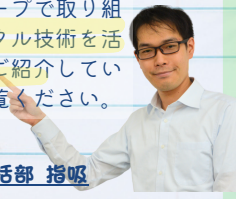
IT企画推進統括部 指吸

P53のDX推進のページ では井関グループで取り組 んでいるデジタル技術を活 用した事例をご紹介します。 ぜひご覧ください。