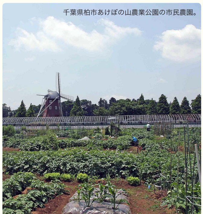
千葉県柏市あけぼの山農業公園の市民農園。