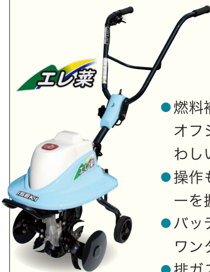
※リチウムイオン電池搭載

静音、クリーンで簡単操作。エレ菜は、人にも環境にもやさしくて、市民農園を利用する皆様のニーズにぴったりマッチする電動ミニ耕うん機です。